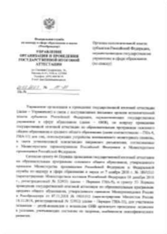
Письмо Федеральной службы по надзору в сфере образования и науки от 01.02.2023 №10-21

Учащемуся предоставляется отдельная аудитория